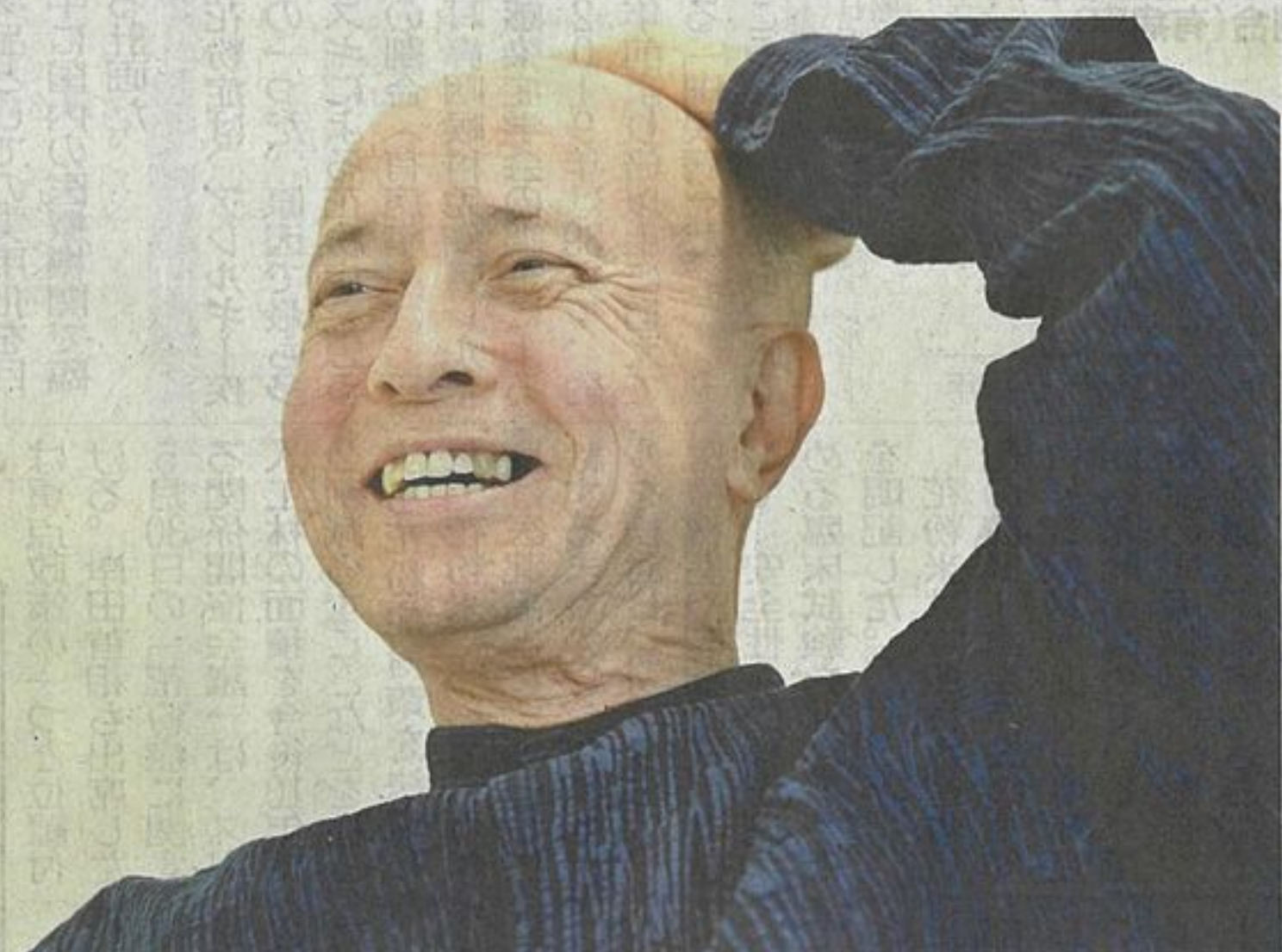
来年末の引退に向け、演奏会の予定は詰まっている。「やりたいうことを、もう一回、全部やるって感じだね」

交響曲の音が出てきたのに、皆、非常に驚きました。大阪には今、プロオケが四つあるけど、なかなか個性が出ないよね。パイ(客)の取り合いになっている。大都市のニューヨークでさえ、良質のオケは二つか三つ。西洋音