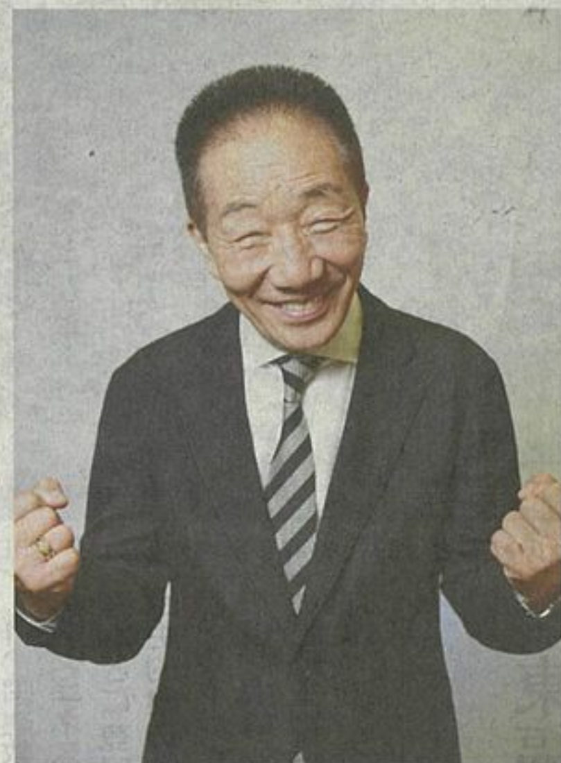
100回目に向けて、気合を入れる中田カウス

多い。来られないならこっちから出向こう」と、相方のボタンとともに、中堅・ベテランの漫才師を率いて全国ツアーを始めた。ボタンが体調不良で休養した19年以降はカウスが1人で主宰し、コロナ禍で休演した1年以外は、月1回程度続けてきた。